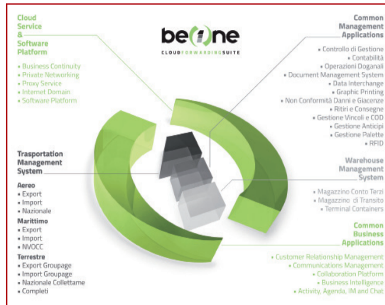
Sintesi delle caratteristiche della soluzione BeOne

Los servicios proporcionados por BeOne son integrables entre sí para ir de la mano con el desarrollo de la empresa y se dividen en cinco macromódulos, a cada uno de