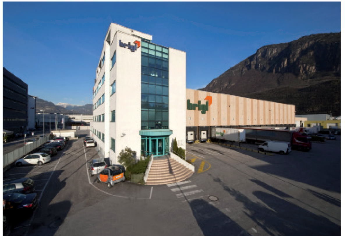
La sede della Brigl a Bolzano. L'impresa, fondata nel 1925, propone un'offerta completa di trasporto (collettame, carichi parziali o completi) per tutta Italia e tutta Europa. Opera inoltre nel comparto delle spedizioni internazionali (via mare e aereo) nonché nell'offerta di servizi doganali e logistici integrati

Hoy Brigl es una de las empresas que los expertos definen como "data equipped" para destacar la importancia que ha adquirido el adecuado manejo de la información. El vocabulario anglosajón es útil para orientarse en el maremágnum de la economía digital. Por lo tanto el almacén se convierte en data-warehouse y a las actividades cotidianas se integra la data analytics, sin embargo lo que ha impulsado Brigl a convertirse al credo del business intelligence son las necesidades concretas, que requieren de respuestas inmediatas inspiradas en las tecnologías más